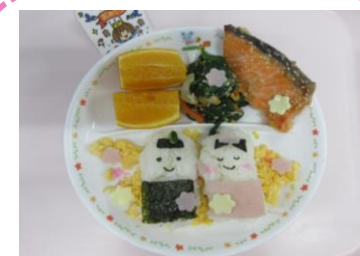
3月の誕生日プレート