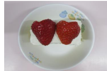
3月の誕生日ケーキ