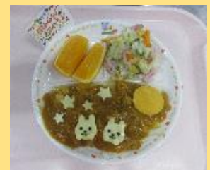
9月の誕生会プレー