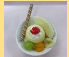
9月の誕生会ケーキ