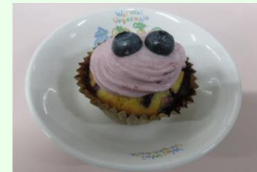
10月の誕生日ケーキ