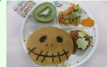
10月の誕生日プレート