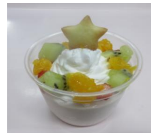
12月の誕生会ケーキ