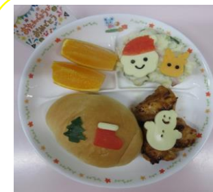
12月の誕生会プレート