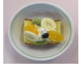
6月の誕生会ケーキ