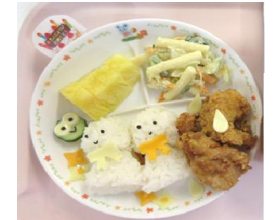
6月の誕生会プレート